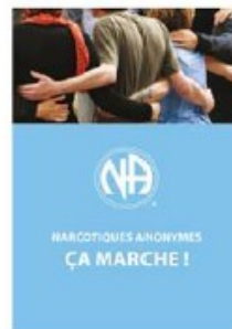
Plaquettes « Narcotiques Anonymes - Ça marche »