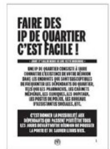
Guides pratique pour les IP de quartier