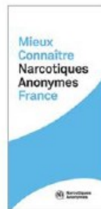
Plaquettes « Mieux connaître NA France »